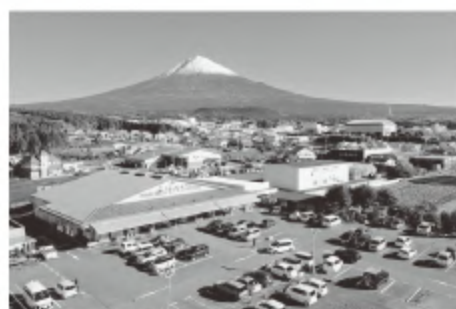
■ファーマーズマーケット「う宮〜な」

地産地消の推進では、学校給食への食材提供をはじめ、各種イベントの開催や参加を通じて管内農畜産物のPR活動を行い、販売物流プラットフォームの構築により管内特産物を地域全域のファーマーズマーケットへ流通させ、地元農産品の良さを幅広く伝えていきます。