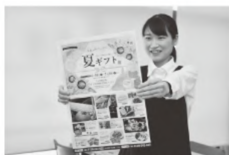
■カタログギフト「マルシェ」