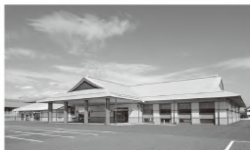
■葬祭ホールやすらぎ