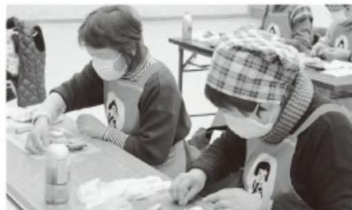
■女性部練り切教室

また、地域助け合い活動や福祉活動などを通して地域の皆さまと交流を深め、豊かな社会づくりに貢献しています。