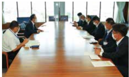
▲小長井市長(左列上段)に農業生産現場の状況を伝える梶専務(右列奥から3番目)

小長井市長は「農産物の価格高騰など、市民への負担は大きく危機的状況だ。農業も大事な産業であり、市民である農家を守るためにもさまざまな対策が必要」と話しました。市は、農業者を支援するため、独自制度となる「農業者肥料購入支援補助金」制度を創設しました。