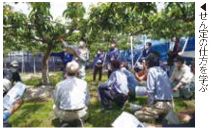
▲せん定の仕方を学ぶ