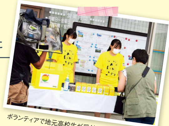
ボランティアで地元高校生が受付を担当(写真は本店)

JA: 8月28日に、JAふじ伊豆本店とファーマーズ御殿場に24時間テレビの募金会場を設置しました。大勢の方が募金に訪れ、その様子は番組内で放送されました。