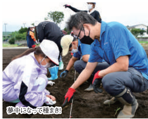
夢中になって種まき!

種まき作業は思っている以上に大変でした。苦勞した分、天ぷらそばにして食べるのが今から楽しみです!