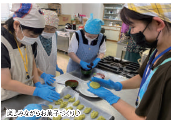
楽しみながらお菓子づくり

茶葉の量や湯の温度など少しこだわることでおいしいお茶が入れることが分かりました! お茶の香りと味に癒やされました!