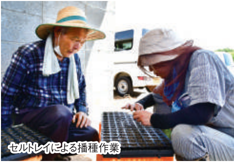
セルトレイによる播種作業