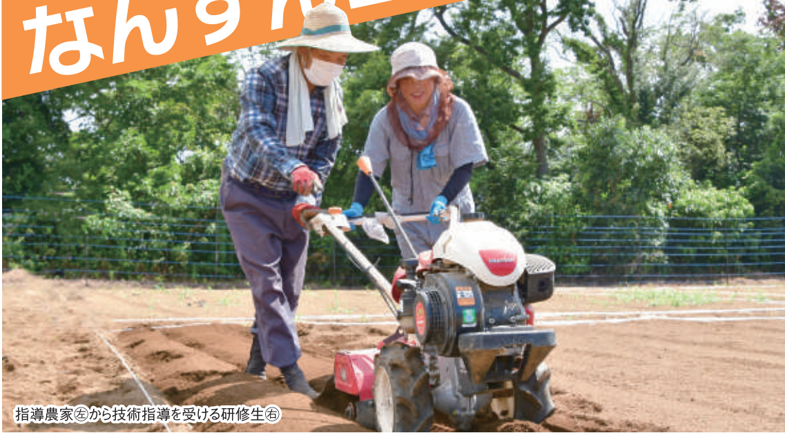
指導農家から技術指導を受ける研修生