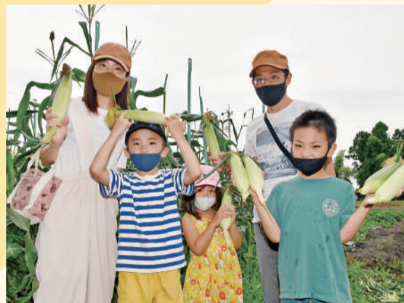
▲収穫したトウモロコシに喜びご家族

富士宮地区営農販売課は、7月16日、富士宮営農センター近くの畑でトウモロコシの収穫体験を開きました。 JAの親子向け食農体験の一つで、参加者は4月下旬に種まきをして育ててきました。収穫体験には30組の親子が参加し、JA職員から採り方のコツを教わりながら協力して収穫作業を楽しんでいました。