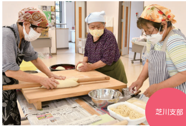
▲うどん作りに励む部員の皆さん