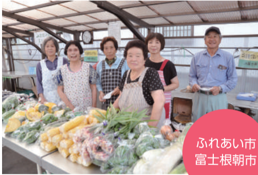
▲ふれあい市富士根朝市の皆さん

来場者には感謝の手紙を添え、富士宮産茶葉100%緑茶「う宮茶」や卵、市指定ごみ袋、メンバーが作ったマリーゴールドのポット苗をプレゼントしました。