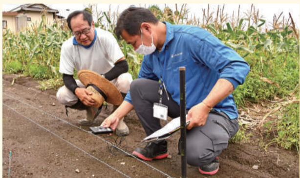
▲設置後、電圧測定器で確認するJA職員

JAは、安全な設置方法や動物ごとの効果的な設置法、漏電防止の下草刈り取りを指導。設置後の申請書類作成のサポートを行うほか、地区購買課では、支柱の抜き差しの手間を軽減する道具も取り扱っています。