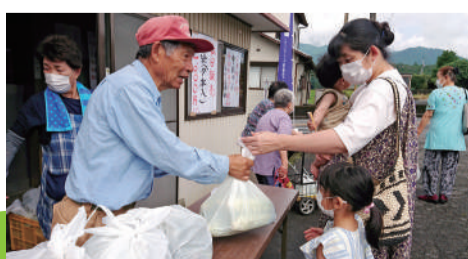
▲トウモロコシを買い求める来場者

原営農作業受委託組合は8月14日、17日の両日、白糸支店に隣接する水かけ菜加工所軒先で、遊休農地を活用して育てたトウモロコシの即売会を開きました。 同組合は、担い手農家を中心に遊休農地対策とほ場保全活動に取り組み、水かけ菜の栽培・販売も行っています。 トウモロコシは14日に540本、17日に400本を販売し、両日ともに開始早々15分ほどで完売するほど好評でした。