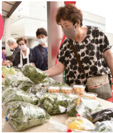
▲にぎわう販売の様子

大宮～なは大宮夕市の夏を代表する販売イベントで、令和3年からは規模を縮小し平日に開いています。