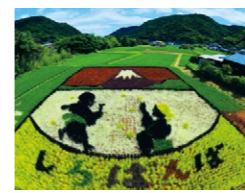
『たんぼアート2022しろぼんぼ』(8月) 下村 俊明さん 撮影地:伊豆市矢熊