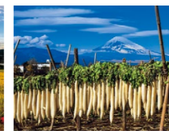
『並んだ大根と吊るし雲』(11月) 諏訪 幸子さん 撮影地:三島市谷田