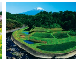
『棚田の朝』(5月) 杉山 初さん 撮影地:小山町竹之下