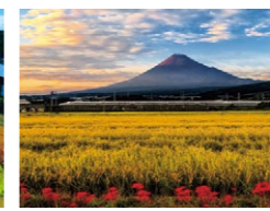
『秋色の田園富士』(9月) 宮崎 泰一さん 撮影地:富士市富士岡南