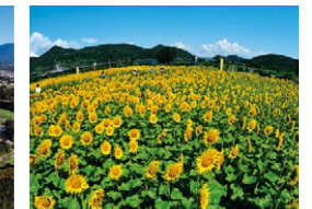
『平和』(7月) 軒村 政春さん 撮影地:富士市岩本