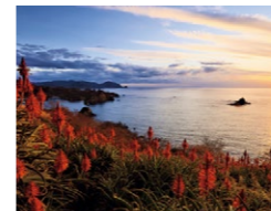
『アロエの丘の夕景』(1月) 藤井 駒一さん 撮影地:西伊豆町大田子今山