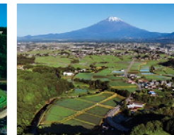
『早朝の田園風景』(6月) 芹澤 光久さん 撮影地:小山町下古城