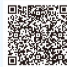
↑静岡県の ホームページはこちら

お問い合わせ JAふじ伊豆 富士地区営農販売課 TEL 0545-61-8124またはお近くの営農経済センター 富士農林事務所・富士市役所農政課へ