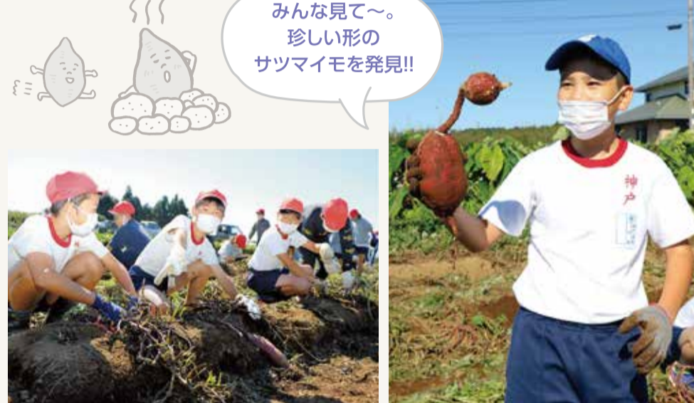
▲大きく実ったサツマイモを掘り起こす児童たち

青年部富士北支部と富士北支店は10月20日、神戸小5年生と6月に定植し、部員が栽培管理したサツマイモ「紅はるか」の収穫を行いました。児童たちは「どのように成長しているのか楽しみ」と胸を弾ませて約300キロを掘り起こし、収穫の喜びを体感しました。