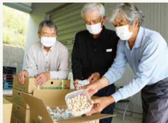
▲生産者が品質や等級を確認