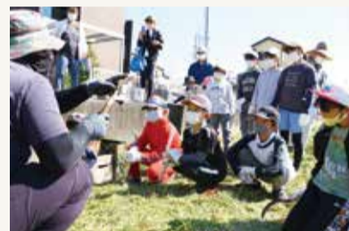
▲鎌の扱い方を教わる子どもたち

青年部富士支部は10月1日、管理する水田に川原宿子ども会の親子を招き、稲刈りやコンバイン乗車体験を行いました。参加者たちは鎌を使って1株ずつ丁寧に収穫。かたい茎に苦戦していた子どもも、刈り方のコツを教わりたくさん収穫できると歓声をあげ、秋の実りを楽しみました。