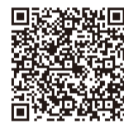
↑産直市情報は こちら

1年のうちで最も昼が短く夜が長い日「冬至」。冬至からだんだん日が長くなるため「一陽来復」といって、新しい年の節目と考えられてきました。冬至にかぼちゃを食べると風邪をひかずに過ごせると言われ、昔から冬の重要なビタミン源として重宝されています。季節の変わり目に邪気をはらう風習として、香り高いゆず湯に入り、体を温め寒い冬を乗り越えましょう。