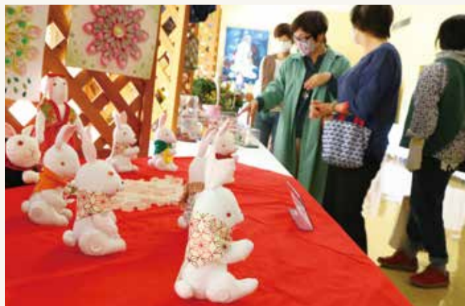
▲心温まる手作り品を見て交流を深める部員たち

みつろうラップづくりなどの目的別グループ活動に仲間と共に取り組み、文化祭で披露して来場した女性部員の心を魅了しました。