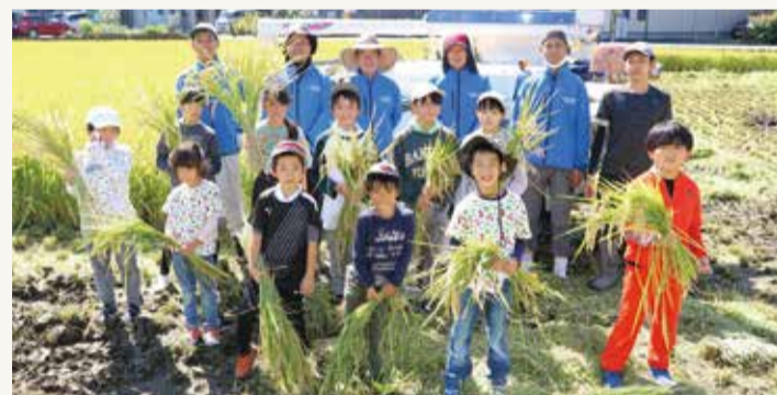
▲青年部富士支部と川原宿子ども会の皆さま