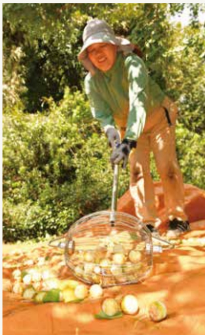
▲ギンナンの収穫作業

富士地区では、「金兵衛」「久寿」「銀河」などの品種を栽培。葉が青い時期に手作業で木から摘み取り、皮をむいて洗浄・乾燥・選別と手塩にかけます。ヒスイ色でほのかな苦み、モチモチした食感が特徴の富士川のギンナンは地元産直市の人気商品です。