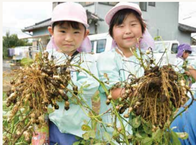
▲たくさんの落花生に笑顔を見せる園児たち