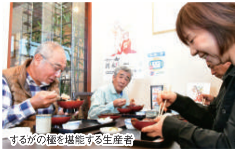
するがの極を堪能する生産者

フェスに参加するため、県内外合わせて約1,100人が飲食店を訪れ、「するがの極」を使ったメニューを堪能し、期間中は約5トンの米が使用されました。SNSでも「#するがの極フェス」で続々と投稿され、フェスを通じて「するがの極」の知名度が向上し、大盛況を収めました。