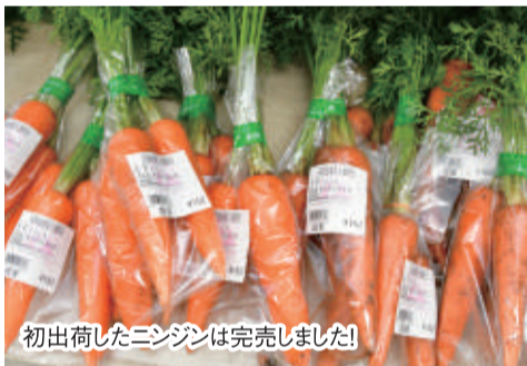
初出荷したニンジンは完売しました!