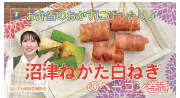
▲ふじ伊豆キッチンのレシピ動画