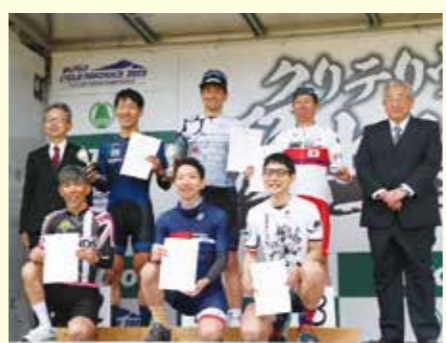
▲ロードレース上位入賞者の皆さま