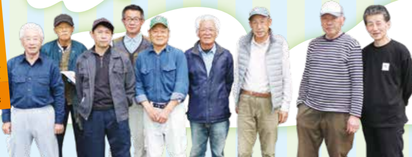
ポケットファームかじま会員の皆さま

営業時間／9:00～12:00 定休日／火曜、年末年始 富士市水戸島187-1 (富士支店敷地内)