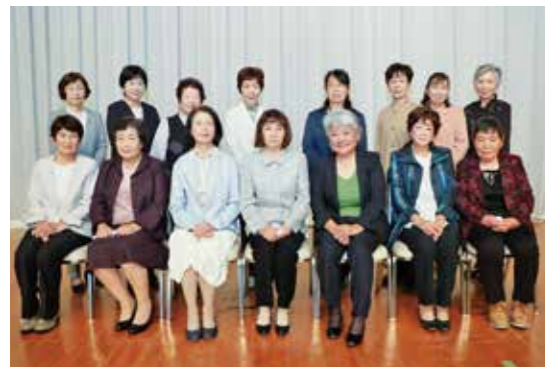
富士地区女性部本部役員会の皆さま