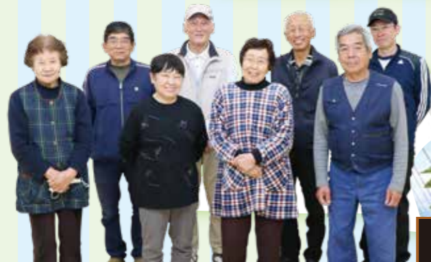
ふれあい元市会員の皆さま