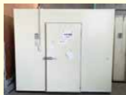
▲新設されたワサビ苗保冷庫

富士地区大淵営農経済センターは、同センター敷地内にワサビ苗貯蔵用の保冷庫を新設しました。保冷庫は「JA 共済地域・農業活性化促進助成金」を活用して設置され、約3万本のワサビ苗が貯蔵可能。苗生産者からは「ワサビ生産者へ良質な苗が提供できるようになる」と、喜びの声が上がりました。