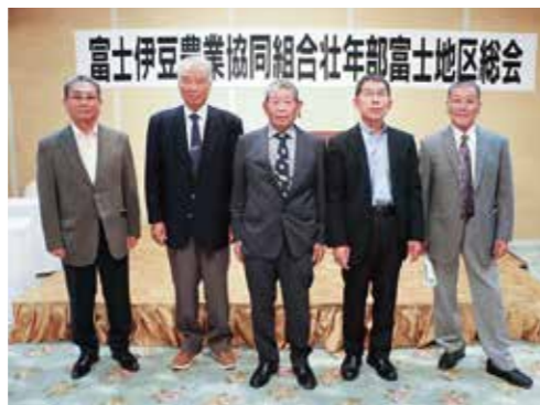
富士地区壮年部本部役員会の皆さま