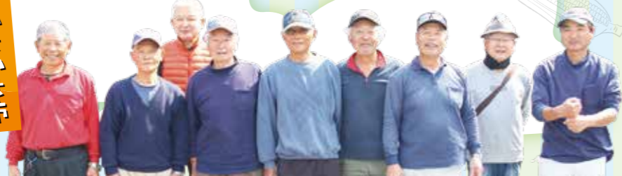
伝法産直いきいき市会員の皆さま

営業時間／9:00～12:00 定休日／日曜、祝日、年末年始 富士市伝法2800-1 (伝法支店敷地内)