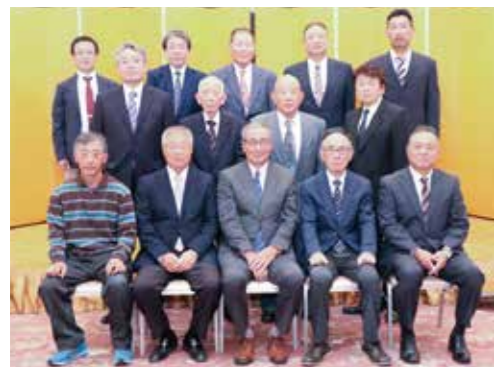
富士地区部農会長委員会の皆さま