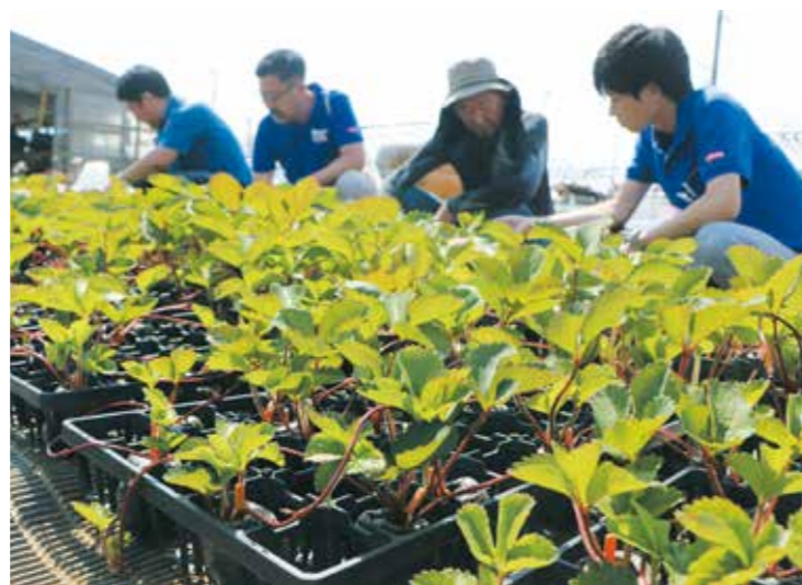
同資材で育苗するイチゴ苗を観察する生産者ら