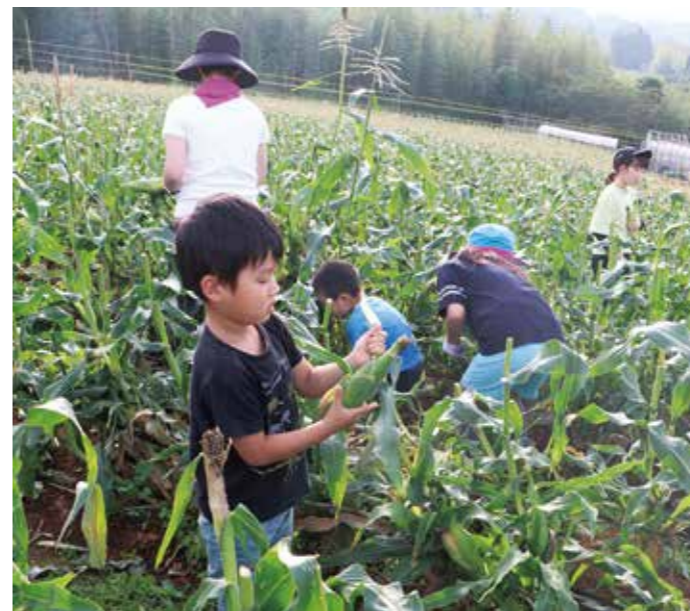
トウモロコシの収穫を楽しむ参加者