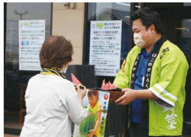
試食用のスイカを配るJA職員(右)

今後も、消費宣伝活動を通じて、地域ブランドの農作物を多くの消費者に伝えていきます。