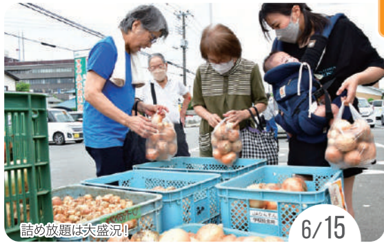
詰め放題は大盛況！