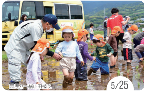
園児と一緒に田植え