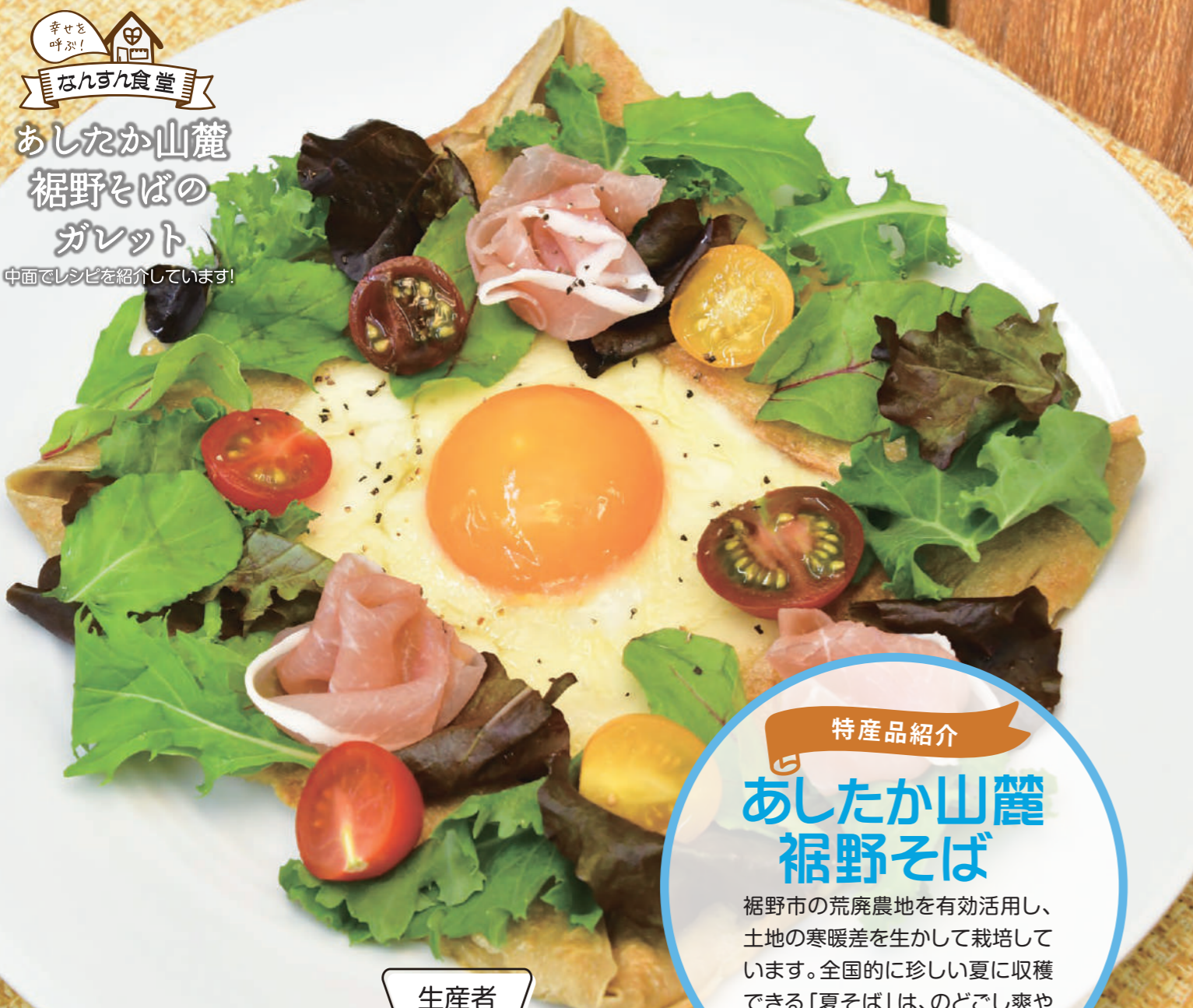
幸せを呼ぶ！ なんすん食堂 あしたか山麓 裾野そばの ガレット 中面でレシピを紹介しています！