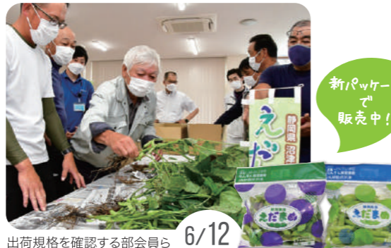
出荷規格を確認する部会員ら