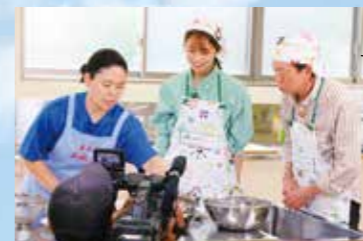
若菜さん(左は) 料理を担当