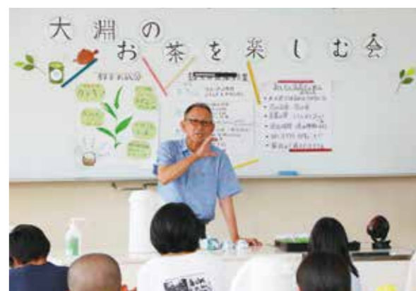
▲部会員がお茶の魅力を子どもたちに伝えました

当JA大淵支店茶業部会は7月19日、大淵第一小学校で5年生を対象に「お茶を楽しむ会」を開きました。部会員7人が講師となり、お茶の効能やおいしいお茶の入れ方を説明。児童たちは急須を使って自分で入れたお茶を味わいました。湯の温度により味が変わることに驚き、「おっっっ」と何杯も飲む様子が見られました。