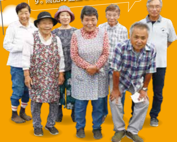
すど良心市会員の皆さま