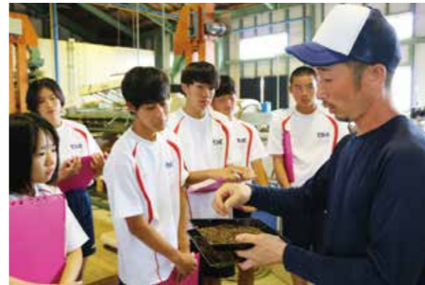
▲焙煎後のほうじ茶の味や香りを確認。香りを生かすには…?

今後、生徒たちは試作などでプランを練り上げ、来年1月に新商品の最終案を発表します。最終的に市などの協力のもと商品化を目指します。若く柔軟な発想力で、素晴らしい商品が開発されることを生産者もJAも期待しています。