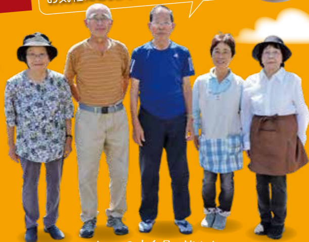
まごころ市会員の皆さま