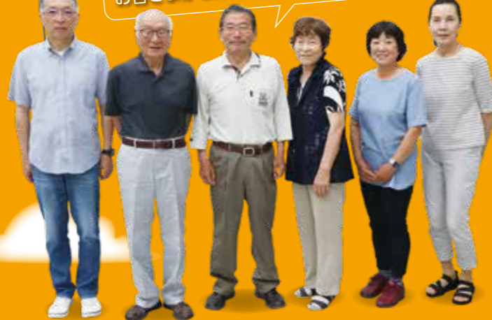
ふじかわ産直市会員の皆さま