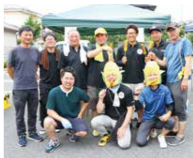
▲青年部富士北支部と職員が「富士山麓わくわくコーン」の焼きトウモロコシを販売

11月には当JA富士地区の各支店で農協祭を開催する予定です。ぜひご来場ください！ JAふじ伊豆 富士地区 農協祭 11月19日(日) 8時30分