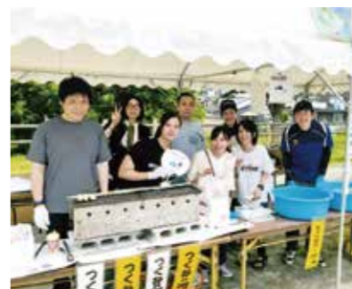
▲原田支店の職員が地元の新鮮野菜や「富士の緑茶」、つくねを販売