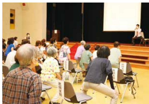
▲柔軟性を高めてけがをしない体づくりを!