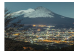
「コンドルが行く」 (1月掲載) 石上 剛也さん 撮影地:御殿場市乙女峠