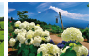
「梅雨の晴れ間」 (6月掲載) 山本 武正さん 撮影地:富士宮市白糸自然公園