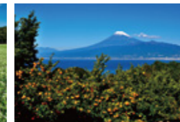
「みかんの丘」 (11月掲載) 伊東 喜一さん 撮影地:沼津市西浦平沢