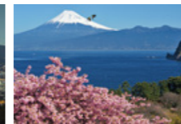
「たわむれ」 (2月掲載) 撮影地:沼津市井田