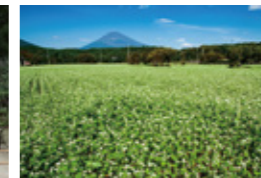
「白一面に広がるそば畑」 (10月掲載) 勝又 守洋さん 撮影地:裾野市下和田