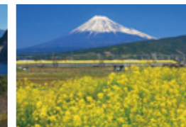
「富士とイエロー」 (3月掲載) 高橋 浩さん 撮影地:富士市中里