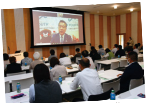
藤木議員とウェブで意見交換

当日は藤木議員も参議院議員がウェブで参加し、国政報告をしたほか、中央会農政営農部職員が「農政の役割」と題して講義を行いました。