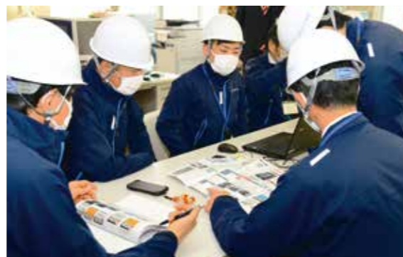
災害用無線機を使用した報告訓練

管内全域での訓練は今回が初。共済業務に関する初動対応を確認した他、災害用無線機を使用して被害状況の報告訓練を行いました。訓練を重ね、迅速・適切な初動対応で、いち早く被災者に安全・安心を提供できるよう体制を万全にしていきます。