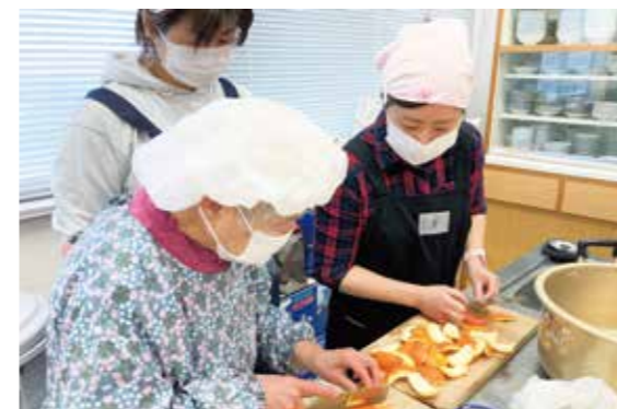
講師の女性部員(手前)から作り方を教わる受講生

地産地消の取り組みとして、特産の「ダイダイ」でマーマレード作りに挑戦。講師の女性部員から丁寧に作り方を教わりました。受講生からは「ダイダイが種以外の全てを使えることに驚いた。おいしく出来てよかった」と大変好評でした。同大学は年8回開催し、食や農の知識の向上に努めます。