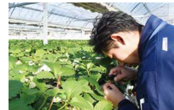
「リモニカ」の生息などを調査する営農アドバイザー

2月29日には「リモニカ®」(リモニカスカブリダニ)の生息や害虫被害などの調査を実施。農薬に比べ駆除効力に即効性はないものの、持続性が高く生産者の労力や費用の軽減が見込めます。5月末まで調査を継続し、本格導入を検討していきます。