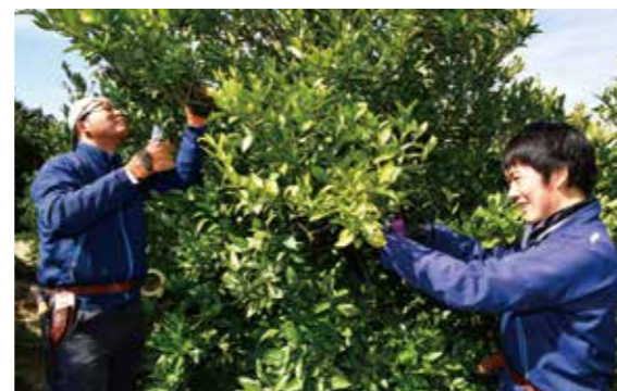
試験ほ場で樹を確認する営農アドバイザー