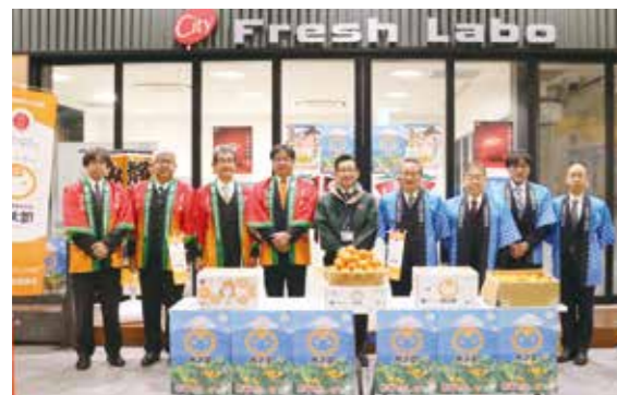
当JA特産物の展示などで市場関係者にPR

特産のイチゴやミカン、トマト、ワサビ、キヌサヤなど7品目を展示PRした他、「西浦みかん寿太郎」を200袋配布。当JA特産物の魅力を発信しました。