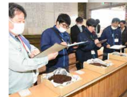
◀堆肥を審査するトップ営農指導員ら