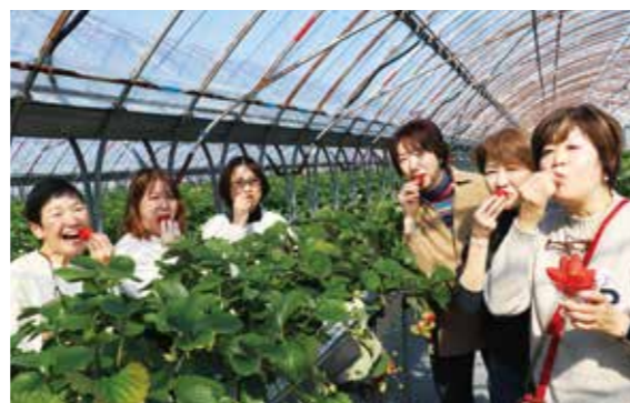
同イベント限定で2品種のいちご狩りを楽しむ参加者

県内外から24人が参加。「みしまるかん」でバックヤード見学や特産物の試食、買い物、「江間いちご狩り」では特別に2品種の食べ比べを楽しみました。その他箱根西麓三島野菜のほ場散策、同野菜やイチゴのランチを味わい、当JAの魅力を楽しみました。