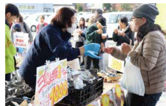
多くの来場者でにぎわった「甘藷祭り」

生産者とJA、地元団体が団結して取り組んでいるもので、2月2日には坂もの祭り会議を開催。反響を呼んだ「大根祭り」「甘藷祭り」の反省点を生かして、今後開催の祭りに向け改善点や計画などを話し合いました。