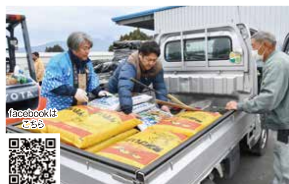
好評だった大感謝祭の日替わりセール

同館では本格的な農業資材から家庭菜園用まで約8,000アイテムを取り扱い、専門職員が案内するなどして充実したサービスの提供に努めています。季節の農作業に関わる農機・資材などのフェアを企画し、facebookなどでも周知しています。