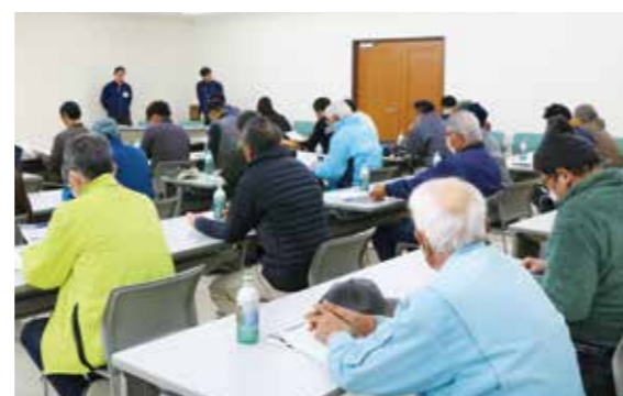
生産者30人が参加し栽培基準を確認

1月31日には栽培講習会を開き、食味向上のための施肥の方法や収穫のタイミングなどの基準を確認しました。5月末から7月にはイベント販売を行い、さらなるブランド力の強化を目指します。