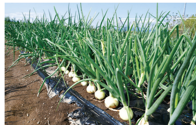
大玉で甘みが強いタマネギ

今回は沼津市大平のタマネギ畑を訪れ、ドローンで撮影しました。畑には白く輝くタマネギが、収穫を今か今かと待ち望むように土から顔をのぞかせていました。上空からはタマネギ越しに狩野川と富士山を望むことができ、絶景です。 なんすん地区で生産されるタマネギは、主に沼津市・清水町・長泉町で栽培されています。培われた技術により、大玉で生で食べても甘みが強く、身の締まりが良いのが特長です。地産地消と食農教育の観点から、学校給食にも出荷されています。 タマネギは5月下旬から出荷を開始し、7月頃まで続きます。ぜひそのおいしさを味わってみてください！