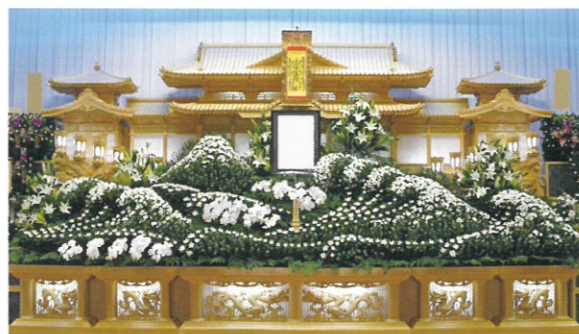
通常価格 550,000円 (税込)