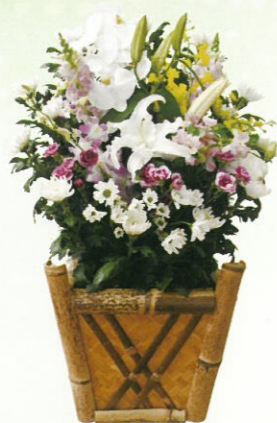
生花C 通常価格 18,000円 (税込)