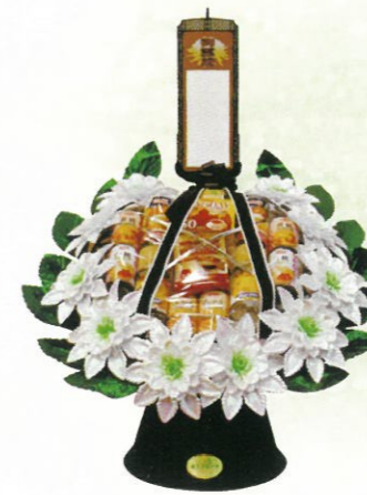
缶詰籠 小 通常価格 11,000円 (税込) 通常価格 14,000円 (税込) 通常価格 18,000円 (税込)