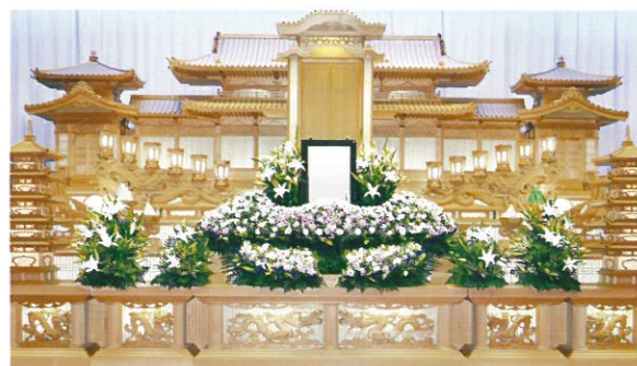
通常価格 165,000円 (税込)