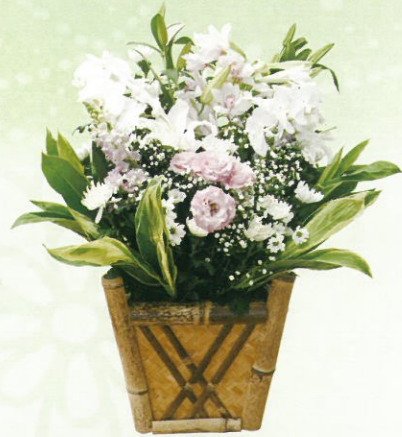
生花E 通常価格 22,000円 (税込)