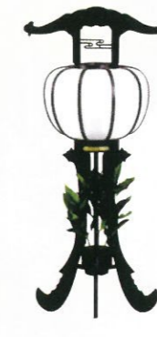
正宗シキミ付 (高さ92cm) 通常価格 12,650円 (税込)