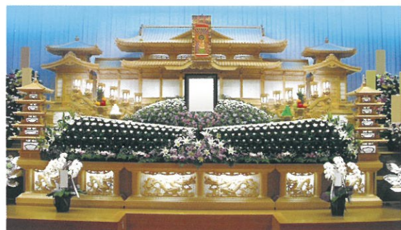
通常価格 330,000円 (税込)