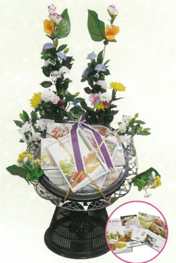
“旬産”静岡産 選べるカATALOGギフト×2 通常価格 14,000円 (税込)