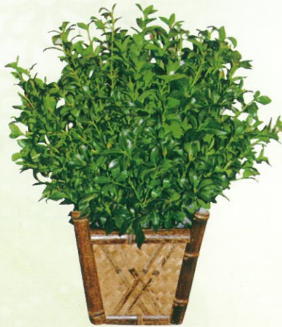
しきみ 通常価格 13,000円 (税込)