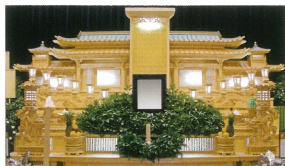
通常価格 88,000円～165,000円 (税込)