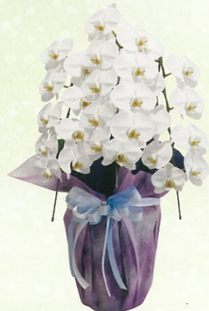
胡蝶蘭 通常価格 20,000円 (税込)