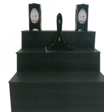
黒壇調3段 (幅86cm×高さ65cm) 通常価格 40,700円 (税込)