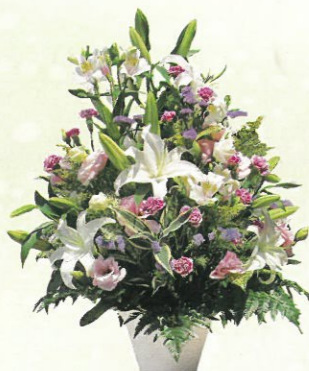
枕花 (高さ約80cm) 通常価格 8,000円 (税込)