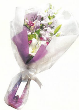
お別れ花 (約70cm) 通常価格 6,000円 (税込)