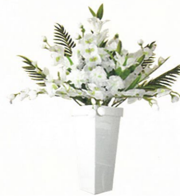
(高さ105cm) 通常価格 12,100円 (税込)