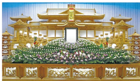
通常価格 220,000円 (税込)