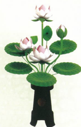
四灯付 (高さ117cm) 通常価格 21,000円 (税込)