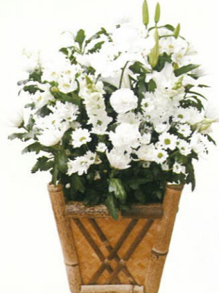
生花D 通常価格 18,000円 (税込)