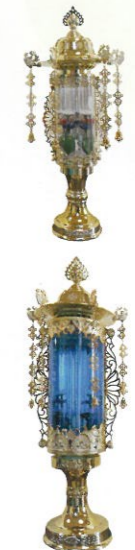
11号 (クリア・ブルー) 通常価格 各23,000円 (税込)