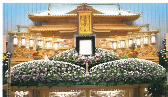
通常価格 220,000円 (税込)