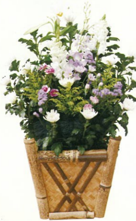
生花A 通常価格 13,000円 (税込)