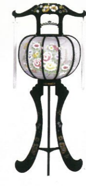
あかね (高さ93cm) 通常価格 12,100円 (税込)