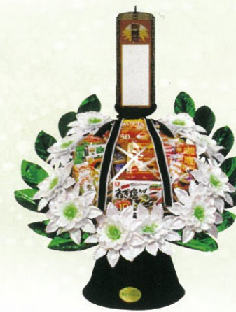
調味料籠 小 通常価格 11,000円 (税込) 通常価格 14,000円 (税込) 通常価格 18,000円 (税込)