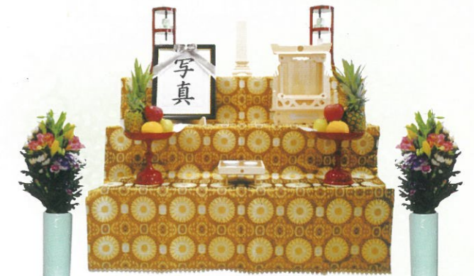
3尺 (幅90cm×高さ120cm) 通常価格 30,800円 (税込)