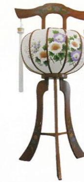
薰3号 (高さ94cm) 通常価格 24,200円 (税込)