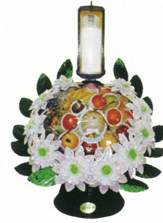
果物籠 小 通常価格 11,000円 (税込) 通常価格 14,000円 (税込) 通常価格 18,000円 (税込)