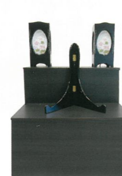
黒壇調2段 (幅58cm×高さ55cm) 通常価格 36,300円 (税込)