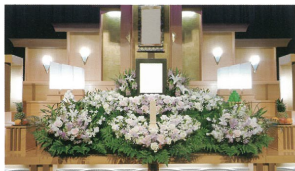
通常価格 110,000円 (税込)