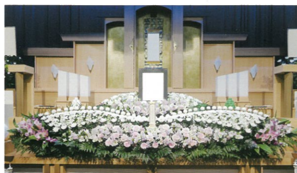
通常価格 143,000円 (税込)