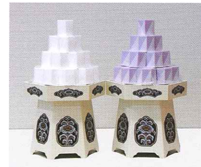
砂糖盛(紫白セット)