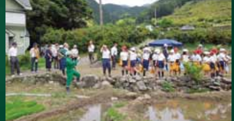
参加者みんなで棚田で田植え

「地域おこし協力隊員を中心に戸田小学校4年生やJA、戸田森林組合が日本の棚田百選にも選ばれている北山棚田で田植えを行いました。収穫が楽しみです」