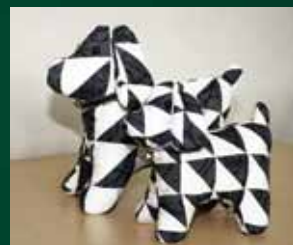
かわいらしい来年の干支の親子の犬

✉ J A 女性部からのたより 「天城しゃくなげの会の皆さまが来年の干支の『いぬ』をちりめん布地や端切れを使って作り女性部大会で展示し好評でした。地元の特産物のワサビやシイタケのつるし飾りも作っています」