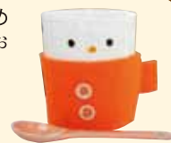
おめかしカップ&スプーンセット

※ご応募いただいた皆さまの個人情報は、プレゼントの発送および当誌へのおたよりの掲載をさせていただく場合があります。