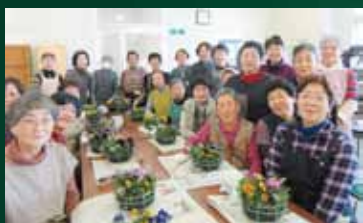
参加者それぞれのオリジナル寄せ植えができました。

「ひまわりセミナーでパンジーとビオラを使って寄せ植えをしました。春先まで楽しめます」