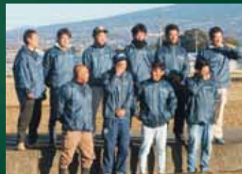
青壮年部などに協力いただき撮影

「県下17JAは自己改革取り組みのそれぞれの特徴を紹介したテレビCMを作成しています。当JAの撮影が皆さまの協力により行われました。放送をお楽しみに」