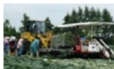
機械化体系の導入