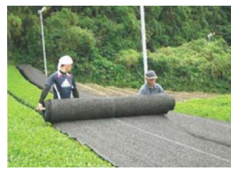
茶の被覆作業の実施