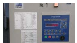
環境制御盤の導入